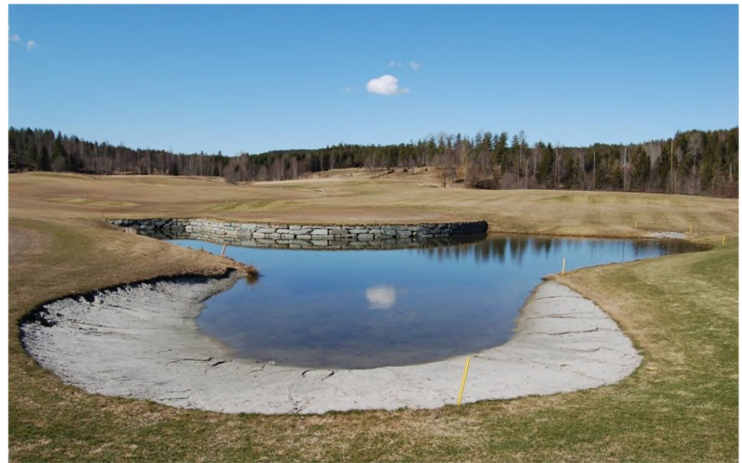
Naturlig rens og avsetningsbasseng.