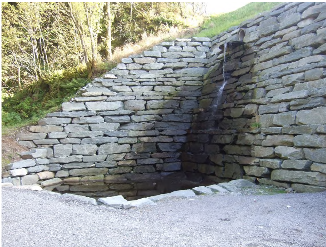
Sandfang og naturlig rensefunksjon