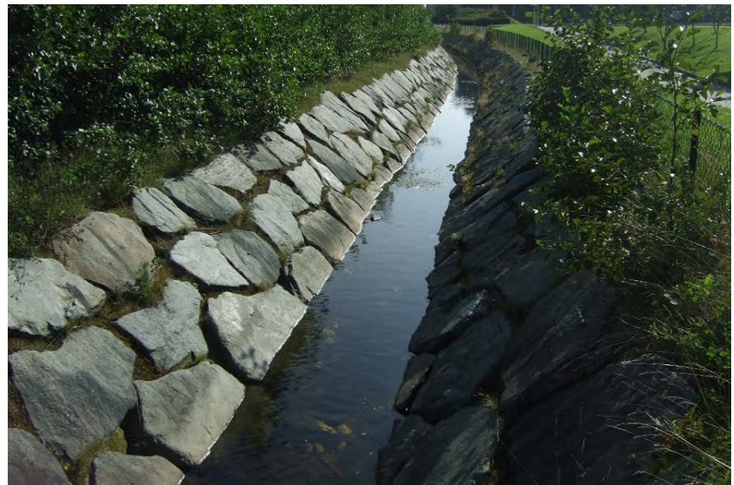
Overvannsrenne med proporsjonal kapasitet og terskler for å beholde et vannspeil som gir liv til flora og fauna.